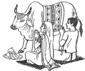
Noch immer werden Rinder als heilig verehrt.

Der vorherrschende kulturelle Einfluss geht auf die indogermanischen Stämme zurück, die vor ungefähr viertausend Jahren mit ihren Viehherden in den Subkontinent einfielen. Diese Siedler, kriegerische, patriarchalische Hirten, die sich selber als Arier 2 (Arya = die Edlen, die Gastfreundlichen) bezeichneten, brachten Pferde, heilige Kühe, das Pferdeopfer und den Sonnen- und Feuerkult mit und prägten die indische Kultur bis heute entscheidend.