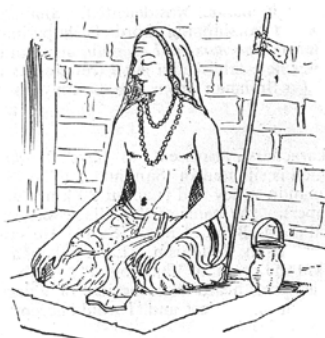
Der Mönch SHANKARACHAYA – Gründer des Shaiva-Monismus

Über Shiva ist relativ wenig geschrieben worden. Er offenbart sich weniger auf Papier, als dass er in den Herzen derjenigen lebt, die ihn lieben. Ja, ihr Leben selber, mit all seinen irdischen Nöten und Freuden, ist seine »Schrift«. Seine Geschichten werden vor allem gelebt im Lebensschicksal der Geschöpfe; sie werden mündlich weitergegeben und in Bildern und Gesängen dargestellt.