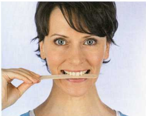
▲ So geben Sie seitlichen Widerstand nach rechts.