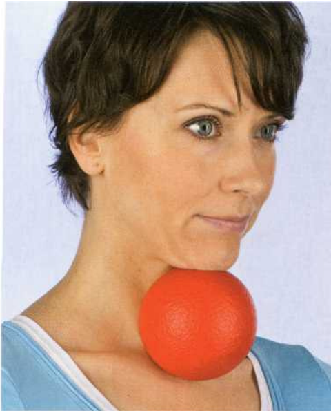
▲ Halten Sie einen Ball unter dem Kinn fest.