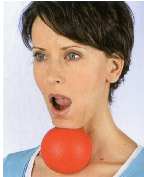
▲ Bewegen Sie mit dem Ball unter dem Kinn den Kiefer in alle Richtungen.

Positionieren Sie einen Ball (Tennisball oder einen kleinen Schaumstoffball) zwischen Kinn und dem Brustbein. Halten Sie den Ball in dieser Position etwa für 10-20 Sekunden.