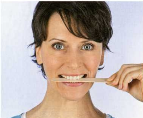
▲ So geben Sie seitlichen Widerstand nach links.