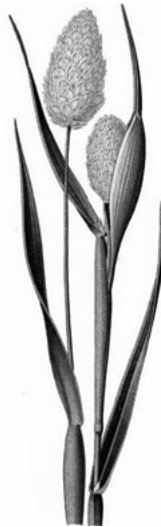
(1) Kanariengras ( Phalaris canariensis ).

Mit einem sehr einfachen Versuch zeigten Darwin und sein Sohn, dass diese Neigung nicht auf die Photosynthese zurückzuführen war, also den Prozess, durch den Pflanzen Licht in Energie verwandeln, sondern vielmehr auf eine der Pflanze innewohnende Bereitschaft, sich auf Licht zubewegen. Für ihren Versuch zogen Darwin Vater und Sohn mehrere Tage lang in einem völlig dunklen Raum in einem Topf Kanariengras ( Phalaris canariensis ). Dann zündeten sie etwa zwölf Fuß von dem Topf entfernt eine sehr kleine Gaslampe an und hielten das Licht so schwach, dass sie »die Sämlinge selbst nicht sehen ... noch eine Bleistiftlinie auf