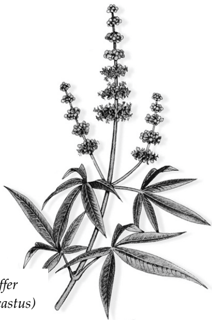
Mönchspfeffer ( Vitex agnus castus )

Mönchspfeffer wird bevorzugt als Fertigarzneimittel eingenommen.