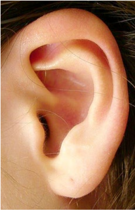
Abbildung 105: Kleines, robustes Ohr links