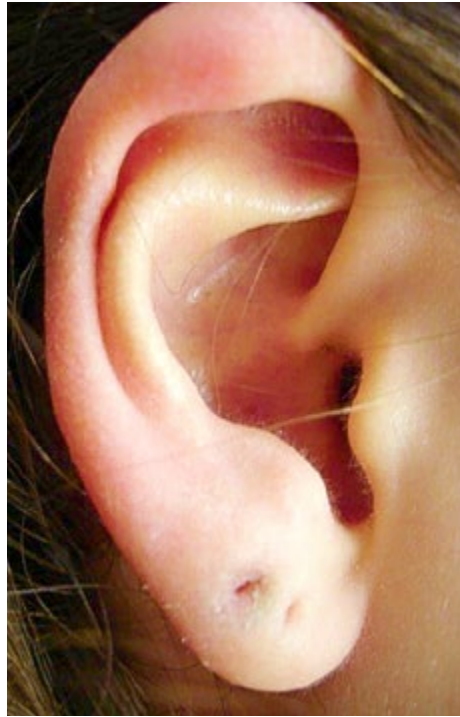
Abbildung 106: Kleines, robustes Ohr rechts