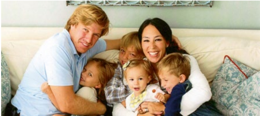
FAMILIENFOTO IM »SHOTGUN«-HAUS.