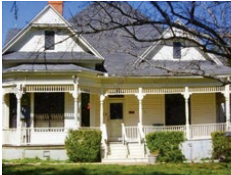
DAS FARMHAUS VOR DER RENOVIERUNG. (VERSTEHEN SIE, WARUM WIR UNS IN DIESES SCHMUCKSTÜCK VERLIEBT HABEN?)