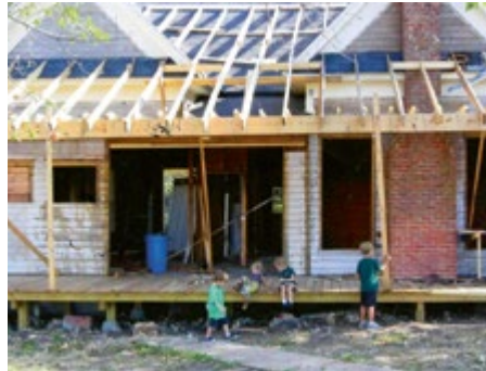
DAS FARMHAUS WÄHREND DER RENOVIERUNGEN.